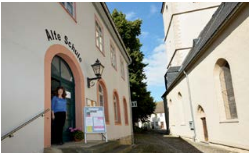
Die „Touristinformation Unstruttal“ in der Alten Schule Wiehe