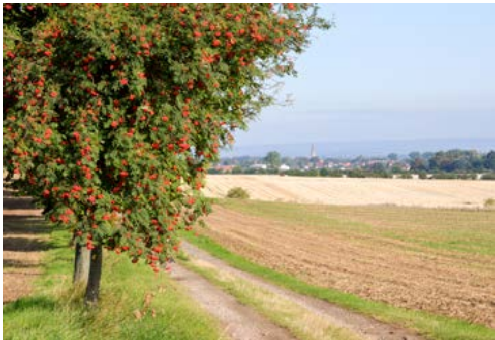
Blick auf Gehofen.

sperrt. Der Innenraum ist schlicht, protestantisches Understatement: Kaum Zierrat, die Wände unverputzt, an den Vorderseiten der Empore ein paar Palmen, die Decke des Chores himmelblau, mit Sternen verziert. Der ganze Schatz der Kirche steht links vom Altar. „Der Taufstein der Kirche ist unser Kleinod“, so Rita Kusche. Der schwere sechseckige Stein stammt vermutlich ist aus dem 17. Jahrhundert, versehen mit aufwendigen Skulpturen, die unter anderem Martin Luther und die Evangelisten zeigen.