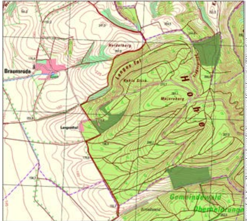
Im Landeswald im nordwestlichen Teil der Hohen Schrecke wurden drei Altholzinseln ausgewiesen (dunkelgrün markiert). Hier findet ab sofort und für immer keine forstliche Nutzung mehr statt.