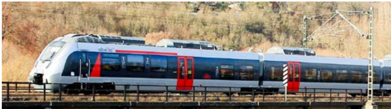
Ab Dezember 2015 kann die Hohe Schrecke mit modernen Zügen erreicht werden.