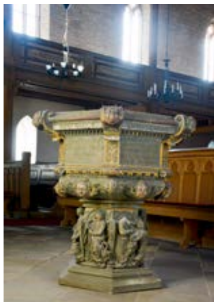
Taufstein in der Dorfkirche St. Johannes Baptist

Die Sandsteinquader, aus denen die Kirche erbaut wurde, leuchten in der Frühlingssonne, während Rita Kusche mit einem großen Schlüssel die Kirche auf-