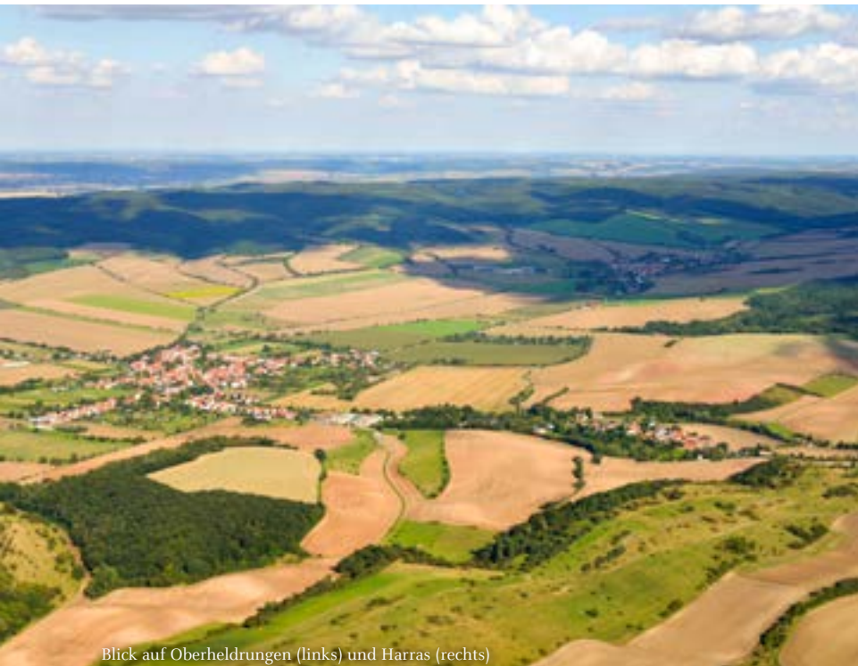
Blick auf Oberheldrungen (links) und Harras (rechts)

Naturstiftung David und Regionalmanagement informieren regelmäßig bei Bürgerversammlungen über die weiteren Planungen. Nach Heldrungen, Wiehe und Donndorf stellte sich das Projektteam im März in Oberheldrungen den Fragen der Anwohner.