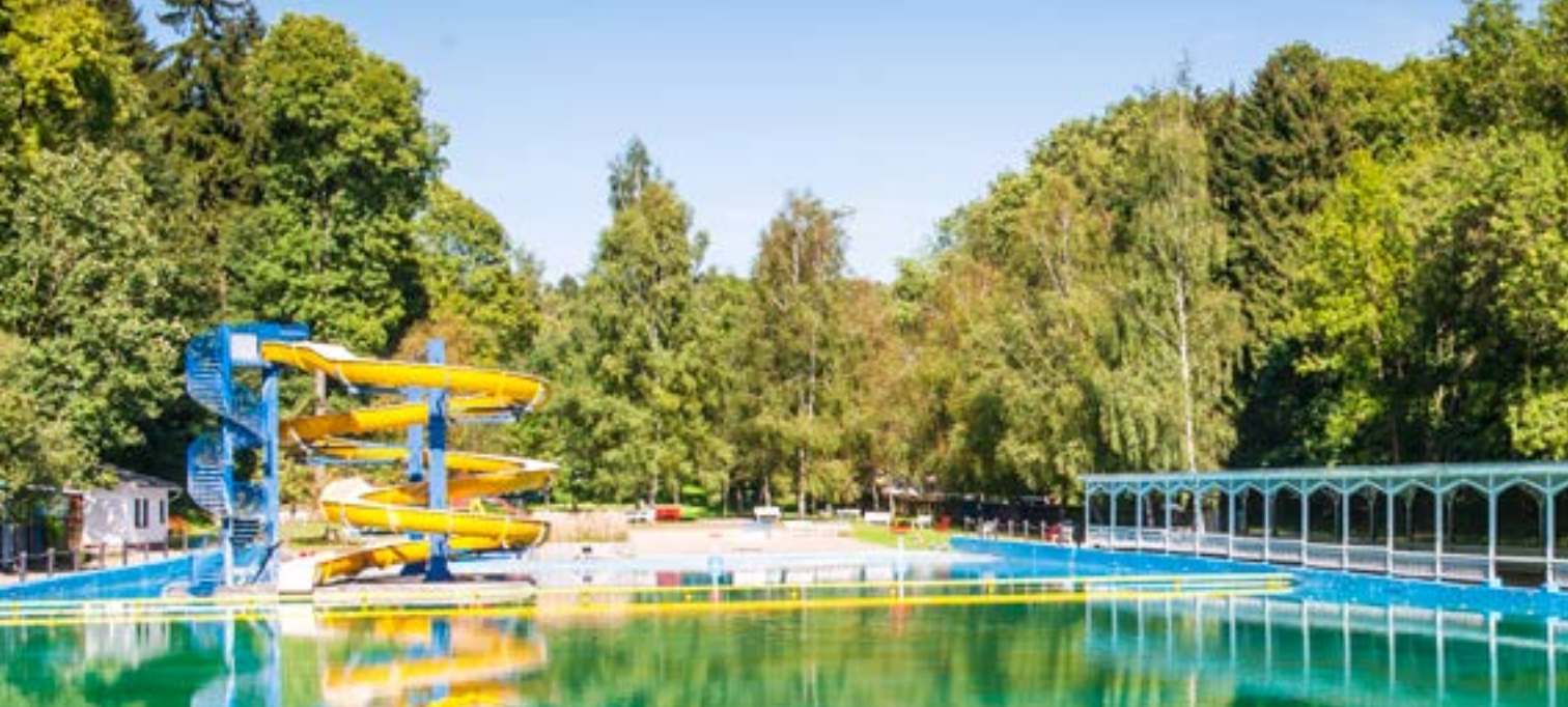
Das Waldbad Rastenberg.